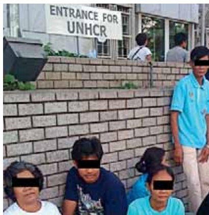
Sie flohen zu Fuß über Kambodscha nach Thailand und bekamen keinen Termin beim UN-Flüchtlingswerk – damit keinen Schutz vor Übergriffen.

Das ViCSCO-Büro wird von einem thailändischen Rechtsanwalt geleitet, der die Nöte und Sorgen durch eine einjährige aktive Vorbereitungsphase kennt, in der die IGFM diese Flüchtlinge bereits mit kleinen Beträgen für Wohnungsmiete und Essen unterstützt hat. Weil aber offensichtlich langfristige Hilfe notwendig ist, und um den Flüchtlingen das nötige Gehör zu verschaffen, musste ein offizielles Büro eingerichtet werden. Im Gründungsjahr will die IGFM das ViCSCO-Büro mit 10.000 Euro unterstützen. Danach soll das Büro selbstständig werden und sich selbst finanzieren. Bitte helfen Sie! Kennwort: Thailand (23)