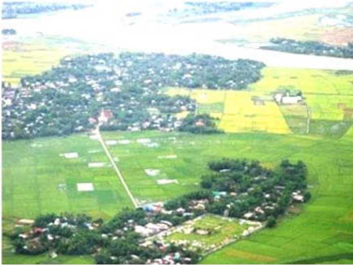
Luftbild von Hoa Xuan