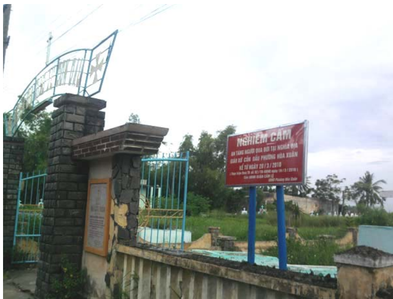
Der Gemeindefriedhof von Con Dau mit dem Schild „Bestattung streng verboten“