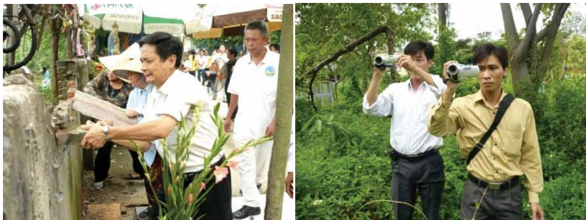
Die Zerstörung der Zaunmauer wurde von der Polizei gefilmt, aber nicht behindert.