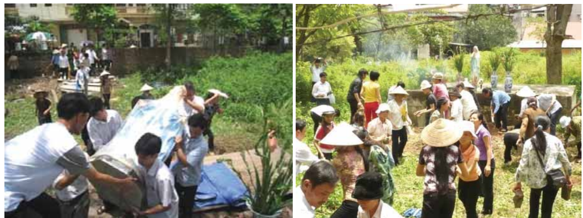
Aufstellen einer der Marienstatuen und Säubern des Platzes

Am Tag des Festes der Maria-Himmelfahrt am 15. August 2008 rissen mehrere Katholiken ein Stück von der zerfallenen Mauer ein, um einen Zugang zum Gelände zu bekommen. Danach wurde das Gelände von Unrat gesäubert und der Weg zum Brunnen frei gemacht. Eine große Marienstatue und ein sechs Meter hohes Kreuz wurden auf das Gelände getragen und auf dem Brunnen aufgestellt. Damit kehrte die Heilige Mutter zu ihrem alten Platz zurück, der ihr früher gewidmet worden war. Später stellten die Gemeindemitglieder mehrere Altäre mit Marienstatuen auf dem Gelände auf.