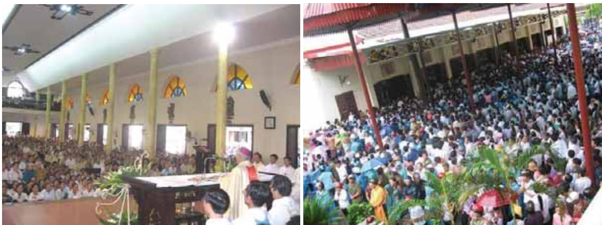
Überfüllter Innen- und Außenbereich der Kirche Thai Ha bei einer Konzelebration am 06.09.08

Am 9. September verschärfte die Behörden den Ton. Erstmals seit Beginn des Konflikts wurden die Geistlichen persönlich angegriffen. Die Polizeileitung drohte dem Erzbischof von Hanoi, Ngo Quang Kiet, und den Priestern in Thai Ha Strafmaßnahmen an. Die Polizeileitung beschuldigte den Erzbischof, den Hanoier Klerus angewiesen zu haben, einen Solidaritätsbrief an die Redemptoristen in Thai Ha zu schreiben. Ferner hätten die Priester in Thai Ha sich schuldig gemacht, indem sie die Protestaktionen der Gemeindemitglieder geduldet hätten. „Die Anwesenheit (der Priester) an dem illegalen Versammlungsort ist als Anstiftung und Agitation anzusehen“, schrieb die Polizeizeitung. 10 Staatliche Medien warfen der Kirche vor, „durch Massengebet, Politisierung, einseitige Berichterstattung und Internationalisierung des Konflikts Druck auf die Regierung ausüben zu wollen.“