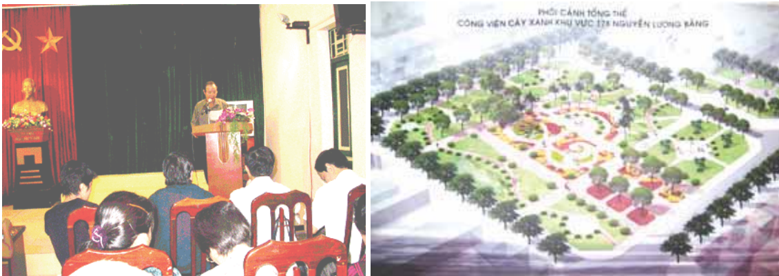
(li.) Verkündung der „Rücknahme“ des Grundstücks am Abend des 22.09.08 (hanoimoi.com) und (r.) Umbauplan des Grundstück, veröffentlicht am 24.09.08 (vitinfo.com.vn)

Die Begründung klang absonderlich: „Der Staat hatte der Bekleidungsfirma Chien Thang AG das Grundstück in der Nguyen Luong Bang Strasse 178 als Produktionsstätte zur Verfügung gestellt. Aber die Firma hat es uneffektiv genutzt und gegen das Gesetz über Land und Grundstück von 2003 sowie gegen die Regelungen der Stadt hinsichtlich der Verwaltung und Nutzung des Grundstücks verstoßen. Das Grundstück wird nun an das Volkskomitee des Distrikts Dong Da zur Verwaltung und Nutzung zwecks Errichtung einer Grünanlage und eines öffentlichen Projekts übergeben, um dem allgemeinen Volksinteresse zu dienen.“ 39