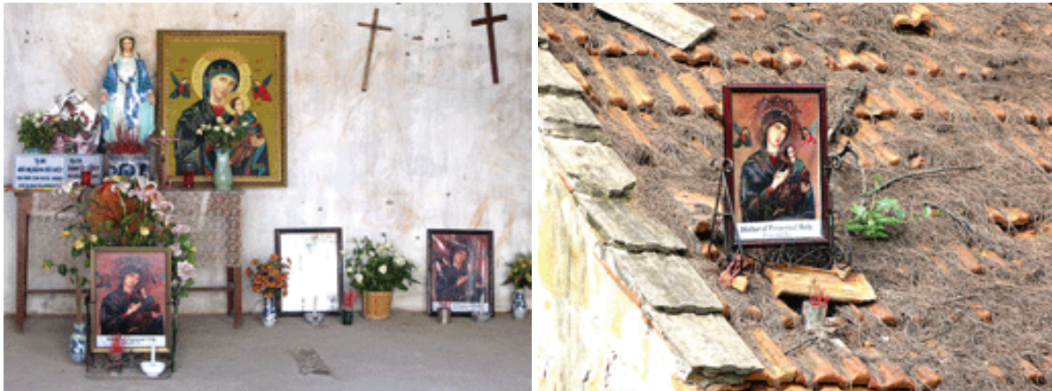
Aufstellen von Marienbildern in und auf den verwaisten Gebäuden 8