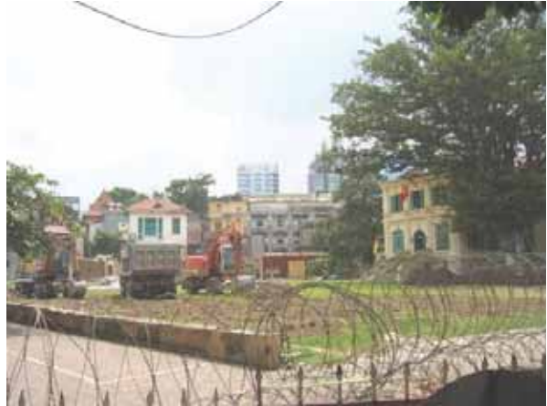
Beginn der weiträumigen Abspernung und der Bauarbeit auf dem Delegatur-Gelände in der Nacht zum 19.09.08