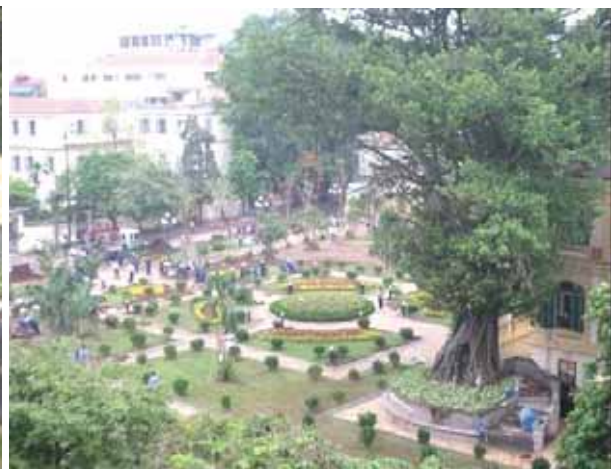
Das Kreuz und die Marienstatue wurden aus dem Park, der in einer Rekordzeit angelegt wurde, am 25.09.08 entfernt.