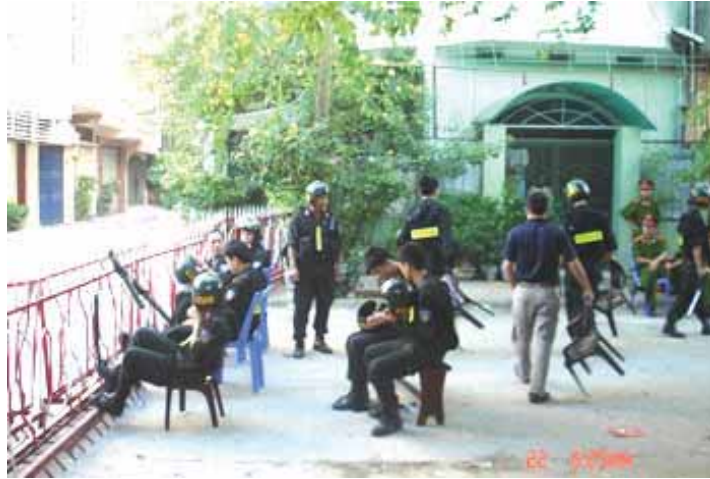
Polizeiabspernung in Thai Ha am 22.09.2008