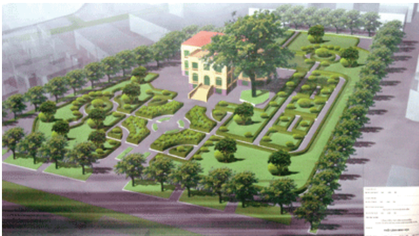
Bekanntgabe des Umbauplans des Delegatur-Geländes durch die Regierung. Hanoimoi online 19.09.08

Obwohl die Regierung mit dem Erzbischof von Hanoi acht Monate lang im Dialog stand, schlug sie am 19. September 2008 eine Kehrtwende ein. In der Nacht zum 19. September sperrte die Polizei das Gebiet um den Erzbischofsitz in Hanoi weiträumig ab. Gleich darauf begannen Bauarbeiten auf dem Teil des Delegatur-Geländes, der an den Bischofsitz angrenzt.