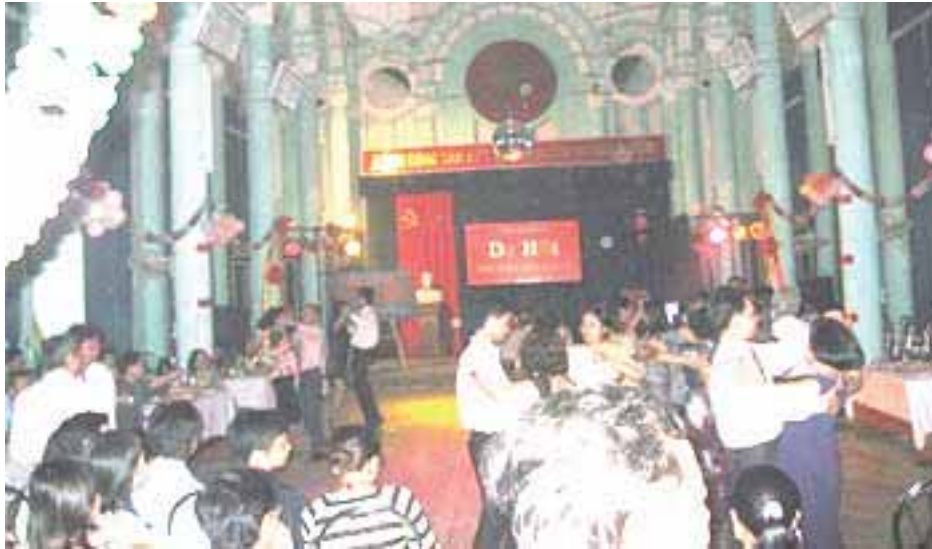
Tanzclub in der ehemaligen Redemptoristenkapelle 3

über dem Katholizismus konfrontiert. Katholiken seien Handlanger der französischen Kolonialisten und antikommunistisch eingestellt, hieß es damals. In der Zeit zwischen 1961 und 1963 wurden im Zuge der Enteignungspolitik mehrere Gebäude der Redemptoristen in Thai Ha von der Regierung willkürlich beschlagnahmt und von staatlichen Stellen zweckentfremdet. Pater Bich selbst wurde 1973 aus dem Klostergebäude vertrieben. Das Klostergebäude wurde erst als Kaserne, später als Krankenhaus (Krankenhaus Dong Da) genutzt. In der früheren Kapelle im Krankenhauskomplex ist heute ein Tanzclub untergebracht.