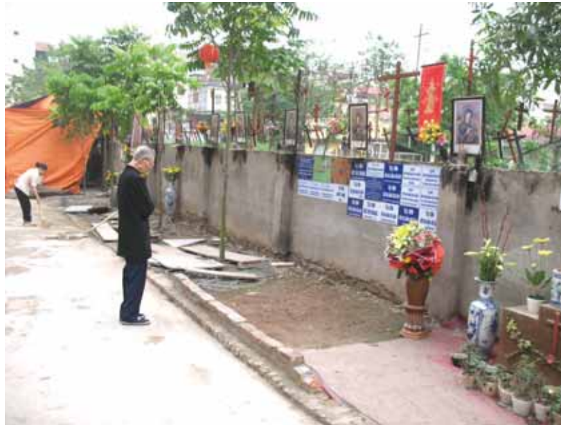
„Strasse der Heiligen Mutter“ entlang der Zaunmauer der Firma Chien Thang

Die Katholiken berufen sich dagegen auf die „Verordnung über Glauben und Religionen“ von 2004. Laut Artikel 26 dieser Verordnung wird legales Eigentum von religiösen Kultstätten und Gemeinschaften vom Gesetz geschützt. Angriff auf Eigentum von religiösen Gemeinschaften ist strengstens untersagt.