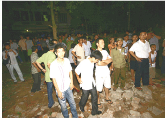
Unter Polizeischutz randalierte „das aufgebrachte Volk“ (rechtes Bild aus Hanoimoi.com, 22.09.08)