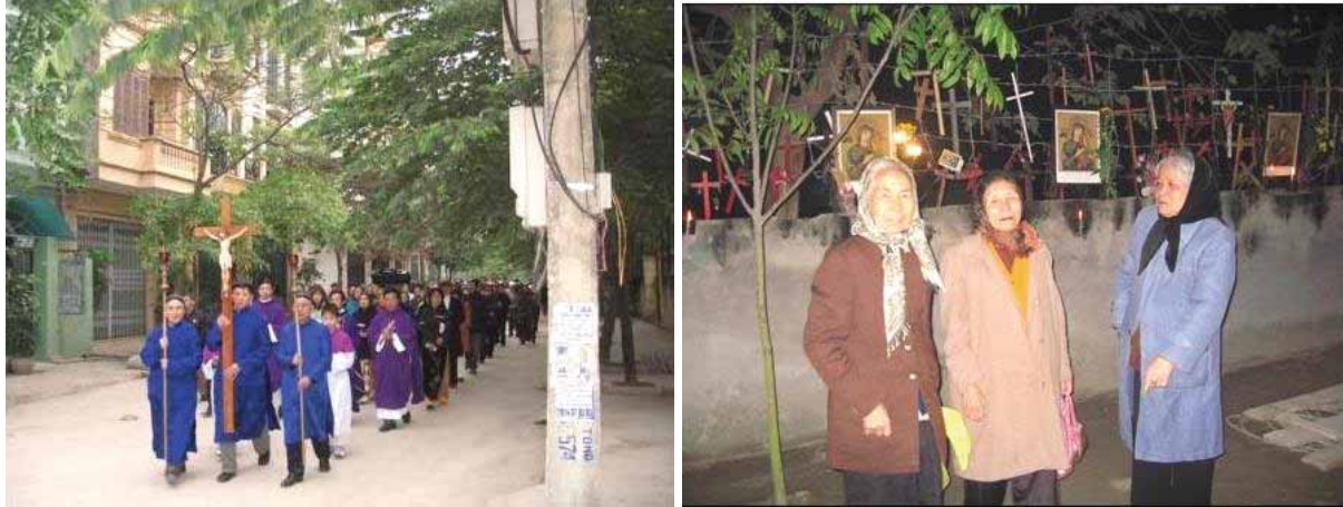
Prozession von der Kirche zum Gebetsplatz (li.) und der „Wachposten“ der Katholiken (r.)

Die Redemptoristen wiesen die Vorwürfe des Hanoier Volkskomitees vom 11. Januar 2008 als unbegründet zurück, weil laut Verordnung über Glauben und Religion von 2004 das Aufhängen von religiösen Bildern und Kreuzen auf kirchlichem Gelände nicht verboten sei. Außerdem hätten die Katholiken den öffentlichen Verkehr nicht behindert, weil sie sich diszipliniert in einer Sackgasse versammelt hätten. Zweimal täglich zu festen Zeiten - um 6 Uhr und 19 Uhr – hätten sie sich für jeweils eine Viertelstunde zum Gebet versammelt. Sie hätten den Platz sauber gehalten und freundlichen Umgang mit Polizisten und Bewohnern gepflegt.