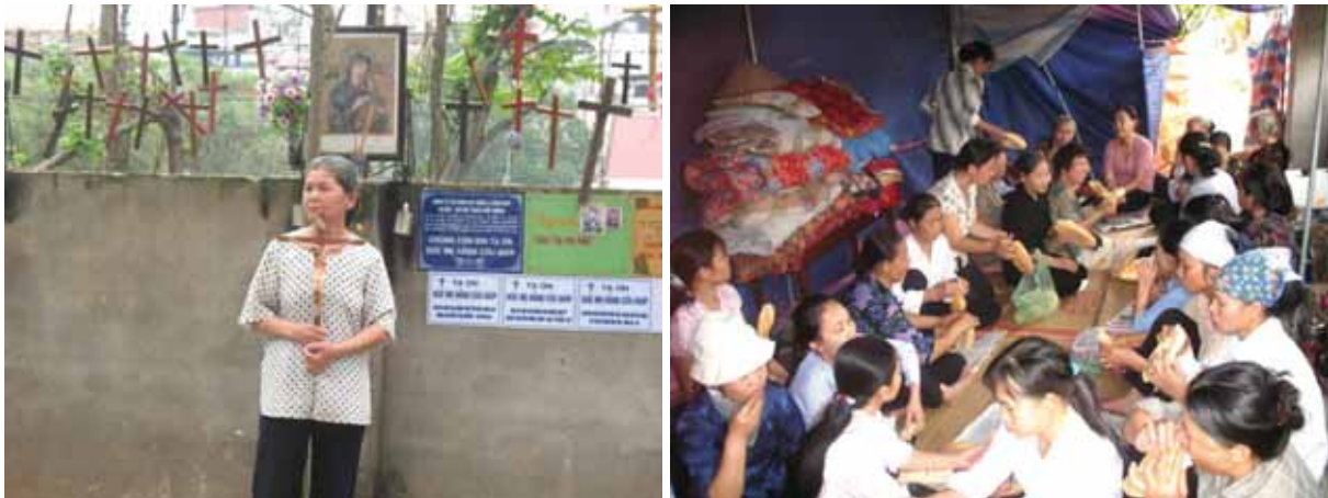
Gemeindemitglieder in Thai Ha am 06.04.08, als das Ultimatum zur Räumung des Platzes ausgesprochen wurde.

Nach Pressegesetz sind die Massenmedien verpflichtet, im Interesse des Landes zu arbeiten. In Fall Thai Ha arbeiteten die Staatsmedien im Einklang mit den Behörden. Sie warben für behördliche Entscheidungen und fuhren Kampagnen gegen die Kirche. Noch im Januar 2008 ignorierten die Staatsmedien die Mahnwachen in Thai Ha, obwohl sich dort täglich bis zu viertausend Menschen versammelten. Fotografen und Kamerateams waren zwar immer auf dem Gebetsplatz anwesend, aber nur, um Bildmaterialien für spätere Kampagnen auf Vorrat zu sammeln.