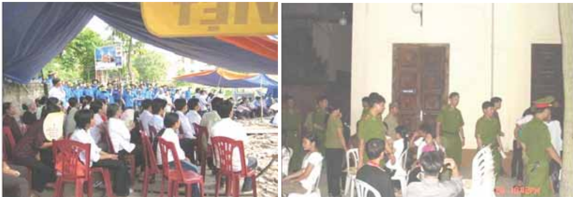
20.09.08: Am Vortag des Pogroms versuchten die „Blauen“ (Bild links), die Gebetstunde zu stören. Am Abend durchsuchte die Polizei das Kloster (Bild rechts).

Auf diese Weise beendet die Regierung den Streit um die ehemalige Apostolische Delegatur und damit auch die Gebetsversammlungen für deren Rückgabe. Der Grund des Scheiterns der achtmonatigen Verhandlung der katholischen Kirche mit der Regierung um die Rückgabe der ehemaligen Apostolischen Delegatur ist bisher unklar. Damals, auf dem Höhepunkt der Demonstrationen vor der Apostolischen Delegatur Ende Januar 2008, hatte der Vatikan die vietnamesischen Katholiken zur Beendigung der Demonstration und zum Dialog aufgerufen. 14 Erzbischof Ngo Quang Kiet hatte offensichtlich dem Plan im festen Glauben an dem Vatikan oder gar an der Zusage eines Regierungsmitglieds zugestimmt.