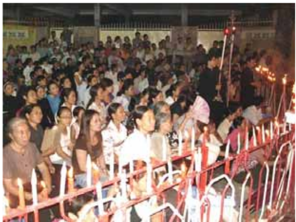
Priester und Katholiken beteten vor der polizeilichen Abspernung