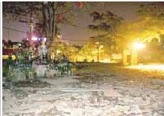
Bild links: Herausgerissenes Eingangstor des Gerardo-Tempels; Bild rechts: Die Randalierer hinterließen ein Bild der Verwüstung auf dem Gebetsplatz

- Gegen 21 Uhr jagten die Randalierer die Katholiken vom Gelände. Die drei Wachzelte wurden zerstört. Ältere Menschen, die sich in den Zelten aufhielten, wurden brutal geschlagen.