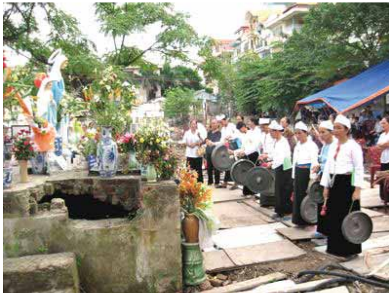
Ethnische Frauen der Muong-Minderheit mit Gongs auf dem Gebetsplatz 43

Am Tag der Maria-Himmelfahrt rissen mehrere Katholiken am 15. August 2008 ein Stück von der zerfallenen „Zaunmauer von der Bekleidungsfirma Chien Thang AG“ ein, um einen Zugang zu ihrem Gebetsplatz zu öffnen. Danach wurde den Gebetsplatz gesäubert. Eine große Marienstatue und ein sechs Meter hohes Kreuz wurden in das Gelände getragen und auf dem Brunnen aufgestellt. Später wurden acht Katholiken deswegen verhaftet bzw. angeklagt.