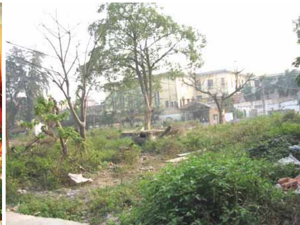
Bild links: 40jähriges Jubiläum der Bekleidungsfirma Chien Thang am 15.06.2008 4 . Bild rechts: Seit Jahren herrscht Verwüstung auf dem Grundstück der Firma Chien Thang