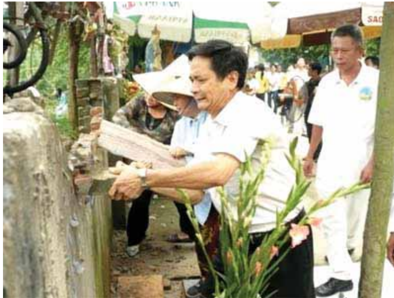
Die „Zerstörung“ der Zaunmauer am 15.08.08 42