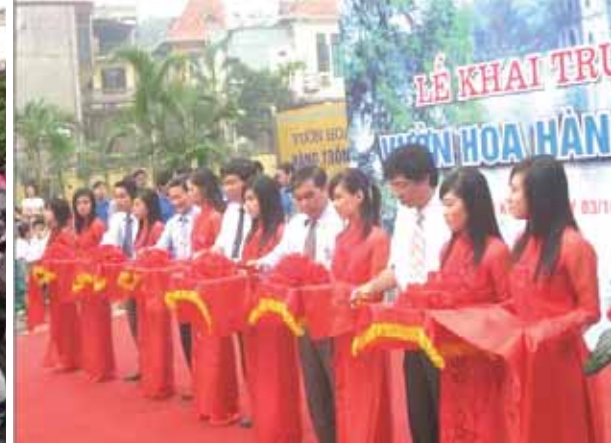
(L) Rund zehntausend Katholiken innerhalb und außerhalb der Kathedrale nahmen mit dem Erzbischof von Hanoi an der Messe am 21.09.08 teil. (R) Der „Blumenpark Hang Trong“ wurde zeremoniell am 03.10.08 eröffnet.

Es war nicht nachvollziehbar, warum die Regierung trotz bestehenden Dialogs die Konfiszierung der Apostolischen Delegatur am 19.09.2008 plötzlich durchsetzen wollte. Mit schweren Baumaschinen wurde das Anlegen eines Parks in einer Rekordzeit von 16 Tagen vollzogen.