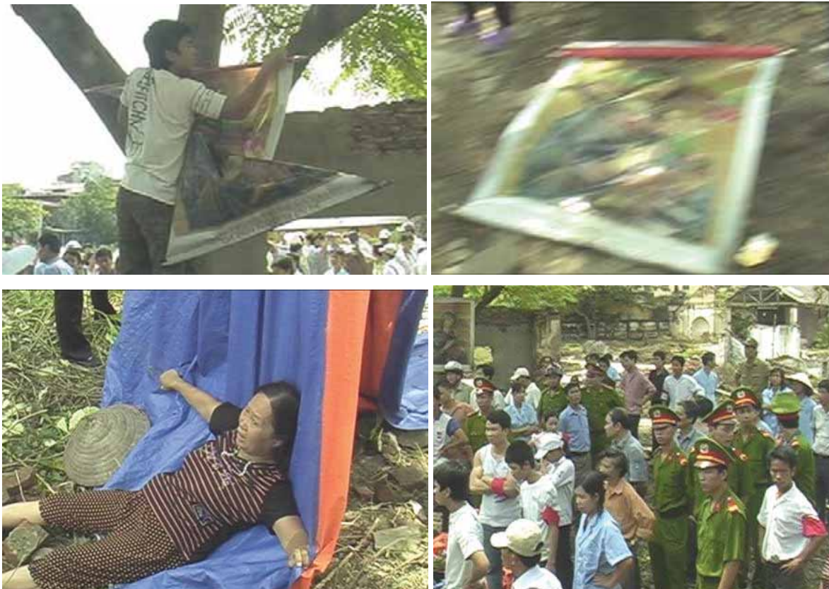
Die Polizei schaute beim Angriff auf die heiligen Bilder auf den Gebetsplatz am 19.08.08 zu.

Am 19. August 2008 rissen mehrere Personen, die sich als Arbeiter der Bekleidungsfirma Chien Thang ausgaben, Marienbilder ab und ein Wachzelt der Katholiken um. Es kam kurzweilig zu Handgreiflichkeit, als die Katholiken die Marienbilder schützen wollten. Die Polizei schritt nicht ein. Staatsmedien stellten später den Angriff als Abwehraktion der Firmenarbeiter dar.