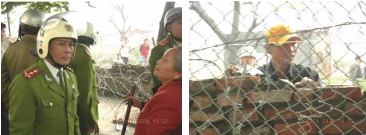
Unter Polizeischutz ließ die Bekleidungsfirma am 6. Januar 2008 eine Mauer hinter Stacheldraht aufziehen.

Mit Schreiben 273/UBND-XV vom 11. Januar 2008 erhob das Volkskomitee der Stadt Hanoi schwere Vorwürfe gegen die Gemeinde Thai Ha: „Die Gemeinde Thai Ha ließ zu, dass einige Katholiken in der Nacht vom 5.1.2008 die Schutzmauer abrisen und das Eigentum der Aktiengesellschaft Chien Thang zerstörten. Seit dem 6.1.2008 ließ die Gemeinde Thai Ha des Weiteren es zu, dass Katholiken und Priester Dutzende von Marienbildern und Kreuzen am Schutzzaun der Aktiengesellschaft Chien Thang angebracht, sich massenweise außerhalb der Kultstätte versammelt und den öffentlichen Verkehr gestört hatten, ...“