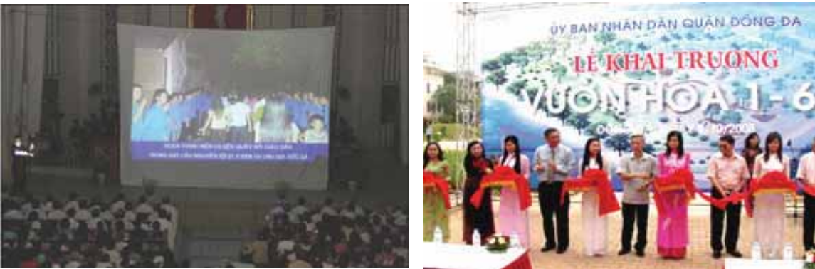
(li.) Einige tausend Katholiken informierten sich am 24.09.2008 in Saigon über die Pogromnacht in Hanoi; (r.) Staatliche Eröffnungsfeier des Parks in Thai Ha am 08.10.2008