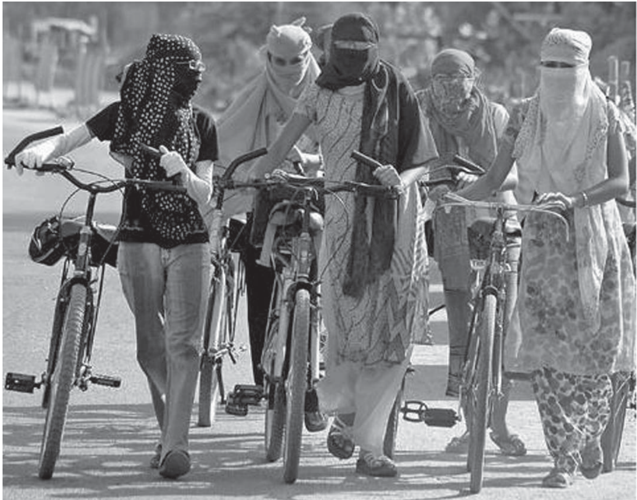
Verschleierte Radfahrerinnen gehören zum alltäglichen Straßenbild.

hart angegangen. Das geschah im allgemeinen Teil des Gefängnisses. Man kann sich nur schwer vorstellen, was in Sicherheitsabteilungen wie der Abteilung 209 des Evin-Gefängnisses oder der „Dou-Alef-Abteilung“, die unter der Kontrolle der Revolutionswächter ist, mit den Häftlingen passiert.