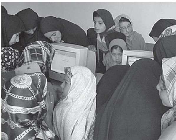
Iranische Frauen und Mädchen erkunden das Internet.

Die Themen reichen von Umwelt- und Tierschutz bis zu Literatur und Kunst. Blogs bieten besonders Frauen einen Raum ihre Themen auszusprechen und sogar mit bestimmten Tabus der Gesellschaft zu brechen. Es