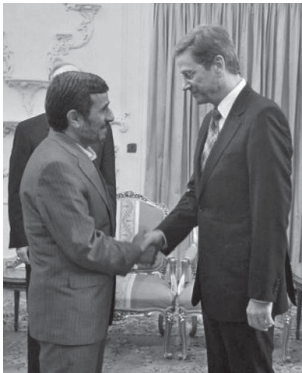
Aufsehen erregte der Handschlag des nach Teheran gereisten deutschen Außenministers Dr. Guido Westerwelle mit dem iranischen Präsidenten Ahmadinedschad im Februar 2011.

Die Mellat- und die Refah-Bank finden sich zudem auf der EU-Sanktionsliste wieder und werden von hohen iranischen Funktionären geführt, deren Namen man ebenfalls auf dieser Sanktionsliste wiederfindet. Über die EIHB wurden und werden auch die für das iranische Nuklearprogramm notwendigen finanziellen Transaktionen abgewickelt. Der