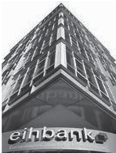
EIHB – Handlanger des Regimes Ahmadine- dschads

Lenze AG mit eigenem Farsi Webportal ( www.lenze.ir ), MultiMetall Reiner Schulze e.K. (mit Farsi Webportal), Schaeffler KG, SWF Krantechnik GmbH, ZF Friedrichshafen und viele mehr.