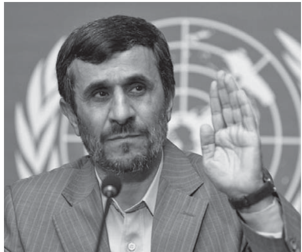
Irans Präsident Mahmud Ahmadinedschad verletzt fortwährend die Menschenrechte und nutzt zugleich das Forum der Vereinten Nationen für Angriffe auf den Westen und Israel.

Über 80 Autoren, Übersetzer, Dichter, politische Aktivisten und einfache Bürger sind bisher Opfer der Serienmorde geworden. Sie wurden auf unter-