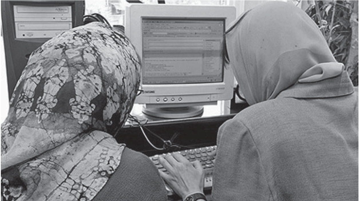
Viele der iranischen Blogger sind gut ausgebildete Frauen.

In einer solchen Situation bieten Blogs große Möglichkeiten. Viele Journalisten haben vor Jahren damit begonnen ihre Texte und Artikel, die sie nicht in der Presse veröffentlichen konnten, in ihre persönlichen Blogs zu setzen.