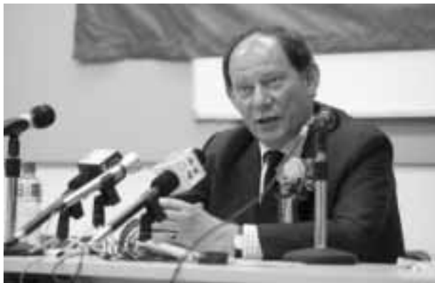
Edward McMillan Scott, Vizepräsident des Europäischen Parlaments

Wir "Damen in Weiß" haben uns daher entschieden, weiterhin friedlich für unsere unrechtmäßig eingesperrten gefangenen