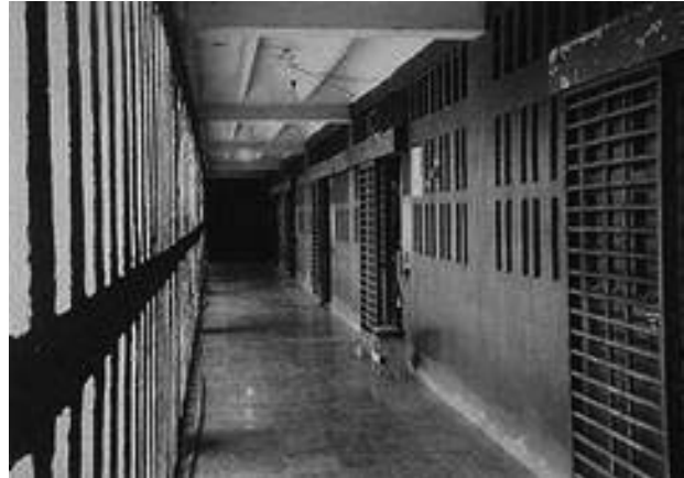
Kubanisches Nationalgefängnis Combinado del Este in Havanna.

Es muss dazu kommen. Es wird nicht schnell gehen und auch nicht leicht, den Lauf der Geschichte umzukehren, aber die Menschen haben das nach fast 50 Jahren verdient.