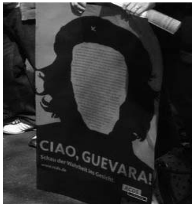
"Ciao, Guevara! Schau der Wahrheit ins Gesicht". RCDS-Plakat bei der Mahnwache für die Freiheit der kubanischen politischen Gefangenen in Bonn am 19. April 2008.

Ich bin überzeugt, dass wir am Ende des Castro-Regimes angelangt sind. Die Castro-Nacht wird vorübergehen. Aber ich bin mir nicht mehr so sicher, was danach passieren wird. Den Menschenrechten Geltung zu verschaffen ist das Wichtigste. Das wird schwer genug, denn es wurde viel Schaden angerichtet und die "Startposition" ist sehr schwer. Man hat in fünfzig Jahren sehr vieles zerstört. Die Menschen haben in der Lüge gelebt und ihre eigenen Wurzeln vergessen.