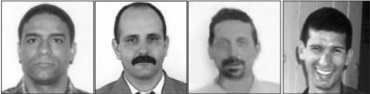
Dr. Oscar Elias BISCET Strafe: 25 Jahre