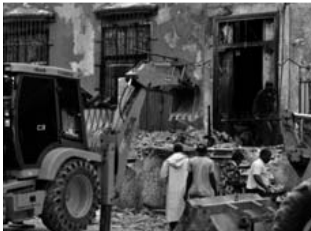
Sturmschäden in Havanna nach Ike.

In Puncto Außenpolitik wurde erwartet, dass er etwas zur zukünftigen Entwicklung der Beziehungen zu den Vereinigten Staaten sagen würde. Bei drei früheren Gelegenheiten waren seine Äußerungen zu diesem Thema von einer gewissen Flexibilität und Rationalität geprägt. Barack Obama, der mögliche Gewinner der Wahlen vom kommenden November, hat für den Fall seines Sieges in Aussicht gestellt, die Kubapolitik zu modifizieren und seine Bereitschaft gezeigt, sich ohne Vorbedingungen mit Raúl Castro zu treffen. Als dieser nun