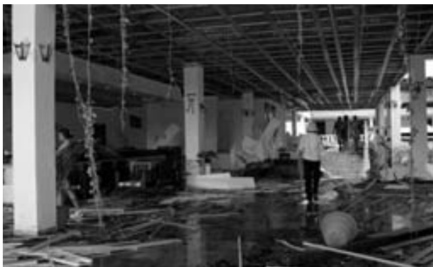
Der Club Amigo Atlantico in Holguin wurde durch den Hurrikan Ike so stark beschädigt, dass Neckermann ihn bis zum Jahresende aus dem Programm nimmt.

sich in gnadenloser Ignoranz. Die Ablehnung der Millionenhilfen des vom Regime so sehr gehassten Exils und seines Asylgebers wird weiterhin vehement von seinem Primus Maximus aufrecht erhalten.