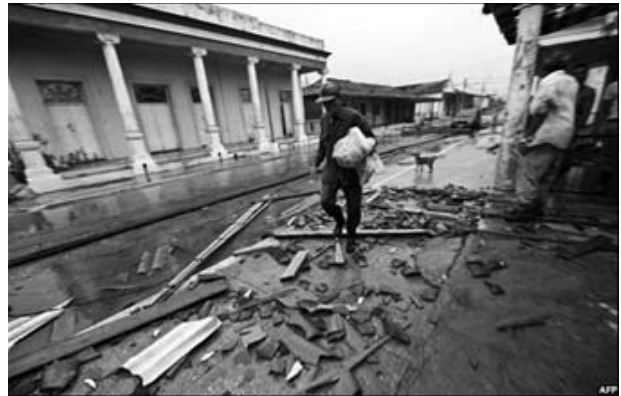
Pinar del Rio

Adressen von politischen Gefangenen oder ihren Angehörigen sowie Auskünfte über Möglichkeiten zur Mitarbeit erhalten Sie bei der IGFM telefonisch unter Telefon 069 / 42 01 08-0 oder per Email bei kuba@igfm.de