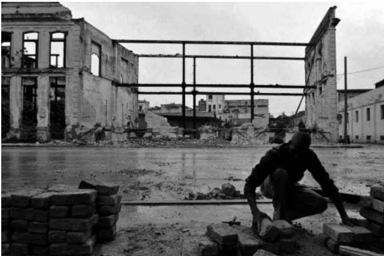
Havanna nach dem Hurrikan Ike.

Dollarläden, die wie ein Netz die Insel überziehen, sind prall gefüllt mit Gütern aller Art; Hygieneartikel, Medikamente, Lebensmittel, Milchpulver, Baumaterialien, Kleidung, alles ist im Überfluss vorhanden, doch außer-