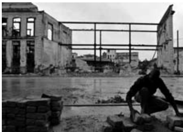
Bilder der Zerstörung nach dem Hurrikan Ike in Havanna. Zur Wiederherstellung der Infrastruktur werden mehrere Jahre benötigt.

Ebenso wird unter Punkt F darauf hingewiesen, dass die Landvergabe beendet werden könnte: "wegen