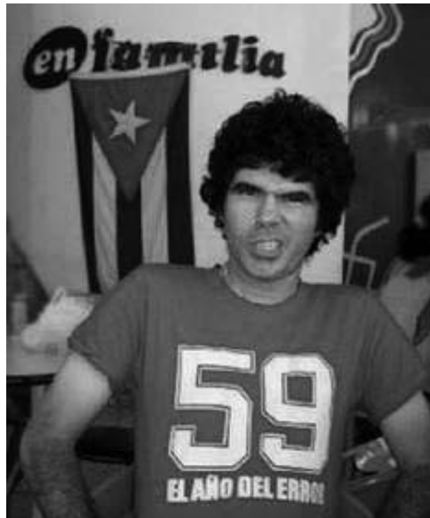
Gorki Águila, Frontmann der regimiekritischen kubanischen Punkrock-Band "Porno Para Ricardo". Auf seinem T-Shirt: "Grosser Irrtum 59" - Hinweis auf 1959, die Machtergreifung durch die Castro-Brüder auf Kuba.

Es war nicht das erste Mal, dass der Wuschelkopf mit dem Silberring in der Nase, der so gar nicht wie ein "Westpunker" aussieht, verhaftet wurde. Der Vater einer elfjährigen Tochter pfeift schon lange auf die Einschränkungen und Repressionen des Regimes und nimmt sein Recht auf freie Meinungsäußerung in Anspruch, wo er gerade geht und steht. Waren die Texte in den ersten Jahren nach der Bandgründung 1998 noch metaphorisch und interpretierbar, gilt seit dem offiziellen Auftrittsverbot im Jahr 2002: Die Dinge werden beim Namen genannt. Ohne Beschönigungen. In besagtem Jahr liefen die Lieder von "Porno Para Ricardo" im kuba-