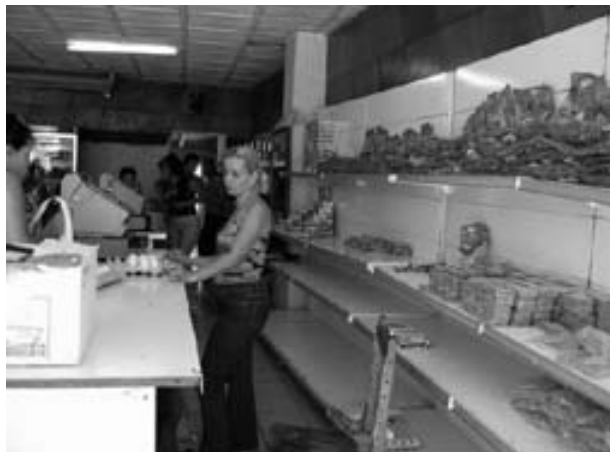
Lebensmittelgeschäft für normale kubanische Bürger.

Diese Zahlen sind für ein Wachstum der Bevölkerung