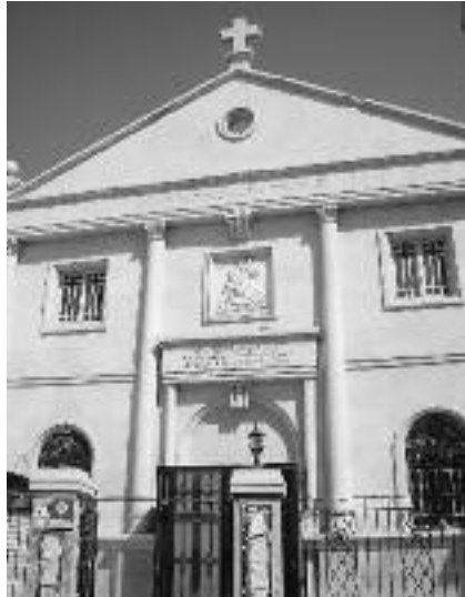
Selbst im repressiven Syrien haben die christlichen Kirchen als Institutionen mehr Freiräume als in der Türkei. Das Bild zeigt eine Syrisch-Orthodoxe Kirche in Damaskus.

Begleitet wird der Staatsnationsbegriff vom Gleichheitssatz. Wie das Nationalismusprinzip hat auch dieser Änderungen im Laufe der türkischen Verfassungsgeschichte erfahren. Art. 69 der Verfassung von 1924 beinhaltete die