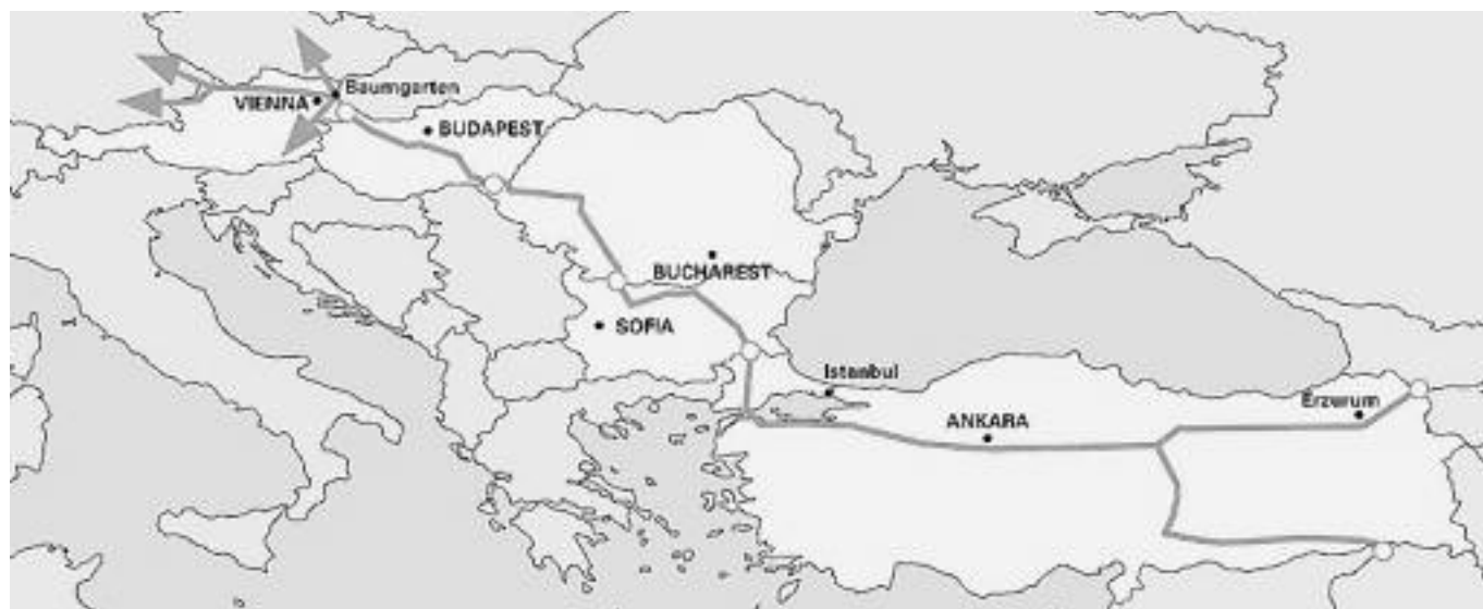
Der Verlauf der Nabucco-Pipeline durch die Türkei und den Balkan.

14. begrüßt die Annahme von Rechtsvorschriften, die alle Einschränkungen für die Ausstrahlung von Sendungen in kurdischer Sprache durch private und öffentlich-rechtliche Sender auf lokaler und nationaler Ebene beseitigen, sowie von Rechtsvorschriften über den Gebrauch der kurdischen Sprache in Gefängnissen; fordert die Regierung eindringlich auf, weitere Maßnahmen zu ergreifen, mit denen sichergestellt wird, dass tatsächliche Möglichkeiten bestehen, im öffentlichen und privaten Schulsystem Kurdisch zu lernen, und, dass im politischen Leben und bei der Inanspruchnahme öffentlicher Dienstleistungen Kurdisch verwendet werden kann; fordert die Regierung auf, dafür Sorge zu tragen, dass die Gesetze zur Bekämpfung des Terrorismus nicht zur Einschränkung der Grundfreiheiten, insbesondere der Meinungsfreiheit, missbraucht werden, und das System der