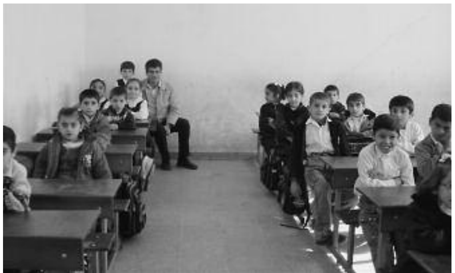
Kinder und Jugendliche beim Aramäisch-Unterricht.

24. bedauert, dass die türkische Regierung weiterhin Vorbehalte gegen die im Völkerrecht verankerten Rechte von Minderheiten anmeldet, dass sie einschlägige Übereinkommen des Europarates noch nicht unterzeichnet hat, und, dass sie mit dem Hohen Kommissar der