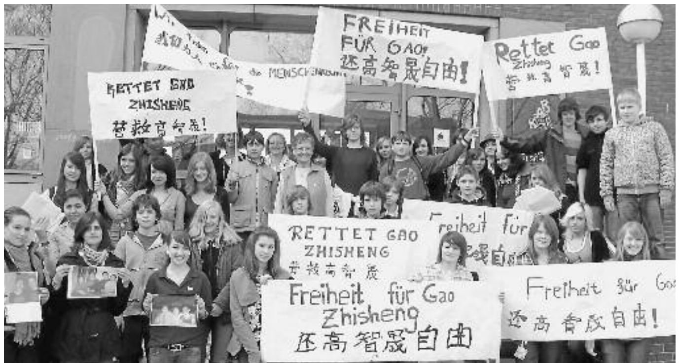
Mit Plakaten und Sprechchören fordern Schüler die Freilassung des Menschenrechtsverteidigers Gao Zhisheng.

in der Menschenrechtserziehung. Sie verdeutlichen was Menschenrechte sind und warum es wichtig ist, sich für sie einzusetzen.