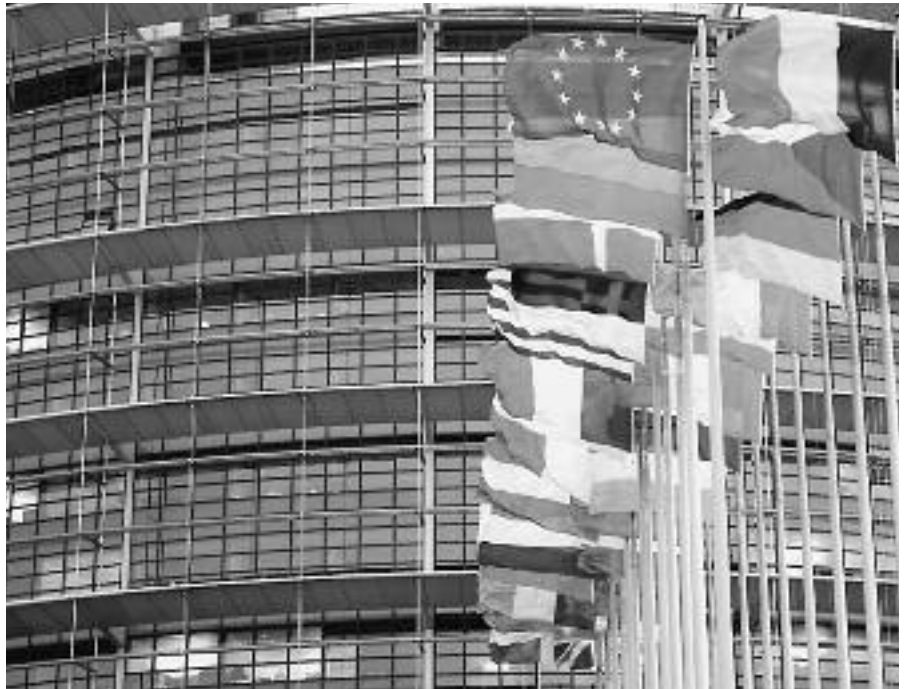
„Die Türkei hat nur geringe Fortschritte gemacht“, stellte das Europäische Parlament in einer Resolution fest.

Das EP „bedauert zutiefst die Entscheidung des türkischen Verfassungsgerichts, die Partei der Demokratischen Gesellschaft (DTP) zu verbieten“ (Art. 8) und „Rechtsvorschriften für nichtig zu erklären, durch die die Zuständigkeit von Militärgerichten beschränkt werden sollte“ (Art. 10). Das Parlament wiederholt auch seine Forderung nach einer