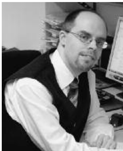
Dr. Daniel Ottenberg.

Die Arbeit beschreibt die internationale und regionale Gesetzeslage wie UN-Gremien und regionale Gerichte, vor allem in Europa und Amerika, komplizierte Rechtsstreitigkeiten zum Schutz der Freiheit der Religionsausübung entschieden haben. Mit über 200 eingearbeiteten Urteilen hat der Autor erstmals den aktuellen rechtlichen Stand der Religionsfreiheit zusammengetragen. Dazu gehörte eine Sichtung aller Urteile des Europäischen Gerichtshofes für Menschenrechte (EGMR) zur Religionsfreiheit, dessen Urteile verbindlich