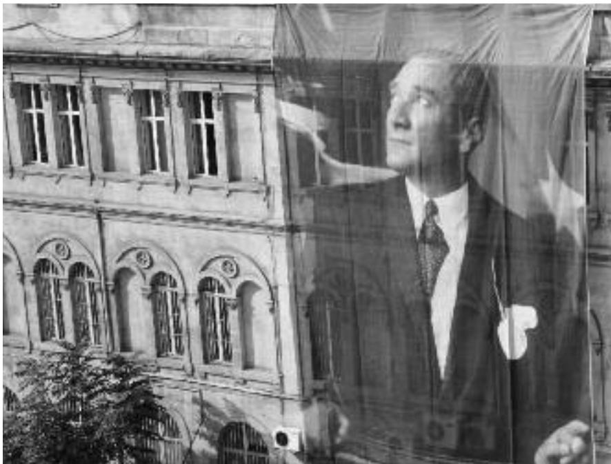
Die nationalistische Ideologie der „Jungtürken“ wirkt noch heute. Im „Atatürkischen Nationalismus“, wie es in der geltenden türkische Verfassung von 1982 heißt, ist selbst für große Minderheiten wie Kurden und Aleviten kein Platz.

Nach dem Ersten Weltkrieg verringerte der „Bevölkerungsaustausch“ mit Griechenland die Zahl der Christen in der westlichen Türkei – auch mit dem Ziel einer türkischen Homogenität. Die Vorzeichen für eine Nationsbildung hatten sich geändert. Es setzte eine Türkische Nationalbewegung unter der Führung von Mustafa Kemal, der später von der Türkischen Nationalversammlung den Nachnamen Atatürk –