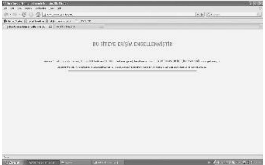
Internetzensur des türkischen Staates: gesperrte Webseite von Youtube.