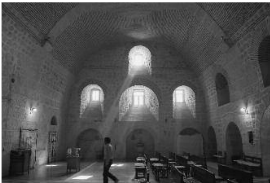
Eines der ältesten Klöster der Welt, das Syrisch-Orthodoxe Mor Gabriel im Südosten der heutigen Türkei, droht die Enteignung großer Teile seines Grundbesitzes. Zahlreiche Immobilien, die sich im Besitz christlicher Stiftungen befanden, sind bereits vom türkischen Staat enteignet worden.

Welche Auswirkungen dies auf die Minderheiten im Einzelnen haben könnte, kann dahingestellt bleiben, denn all diese Änderungsvorschläge finden sich im Entwurf des Verfassungsänderungsgesetzes, der am 12. September 2010 dem Willen des Volkes zur Entscheidung vorgelegt wird, nicht mehr. Aus der geplanten großen Verfassungsreform, mit der eine von Grund auf neue Verfassung angedacht war, die die Türkei auf den Weg zu einem entideologisierten pluralistischen Staat bringen sollte, ist eine zaghafte Verfassungsänderung übrig geblieben, die weder die Grundlagen des Staates noch die Einschränkung der Grundrechte antastet. Für die Minderheiten ändert sich nichts.