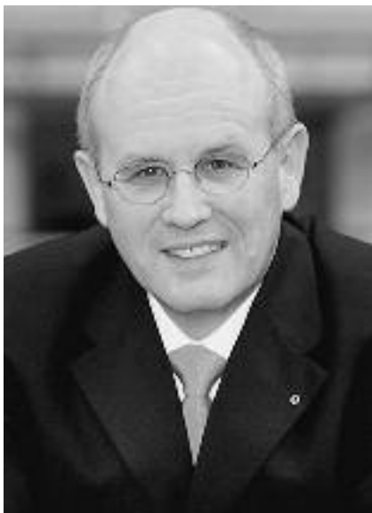
Volker Kauder, Vorsitzender der CDU/CSU-Bundestagsfraktion, warnt davor, aus außen- oder wirtschaftspolitischen Gründen Verletzungen der Religionsfreiheit hinzunehmen.

Kauder verwies darauf, dass die Christen die wohl am stärksten verfolgte Religionsgemeinschaft seien. Sie müssten in vielen Teilen der Welt „um Leib und Leben, ihr Hab und Gut fürchten“. Allein in Nigeria seien vor einigen Monaten Tausende von Christen getötet