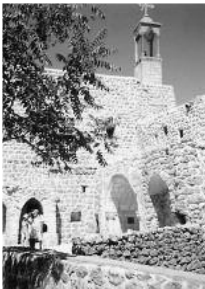
Vor dem Kloster Mor Gabriel.

26. ist besorgt darüber, dass der türkische Rechtsrahmen immer noch keine ausreichenden Garantien für die freie Meinungsäußerung bietet, und, dass einige Gesetze weiterhin missbraucht werden, um diese Freiheit einzuschränken; fordert die türkische Regierung auf, eine umfassende Reform des Rechtsrahmens in Angriff zu nehmen, um seine Vereinbarkeit mit der EMRK und der Rechtsprechung des Europäischen Gerichtshofs für Menschenrechte sicherzustellen; stellt fest, dass die Überarbeitung des Artikels 301 des türkischen Strafgesetzbuches zu einem erheblichen Rückgang der Strafverfahren im Vergleich zu den Vorjahren geführt hat; ist jedoch weiterhin der Auffassung, dass Artikel 301 und Artikel 318 aufgehoben werden sollten;