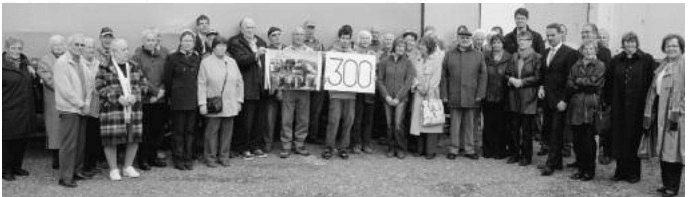
Sechzig freiwillige Mitarbeiter und zahlreiche Spender: Am 14. Mai 2010 ging der 300. Hilfstransport der IGFM-Arbeitsgruppe Wittlich Richtung Litauen auf den Weg.

Auf die Frage nach ihrem aufregendsten Erlebnis meint Sie „Es war der erste Hilfstransport nach Litauen und die Begegnung mit dem ersten Staatsoberhaupt Vytautas Landsbergis“ – den sie für das Kuratorium der IGFM gewann.