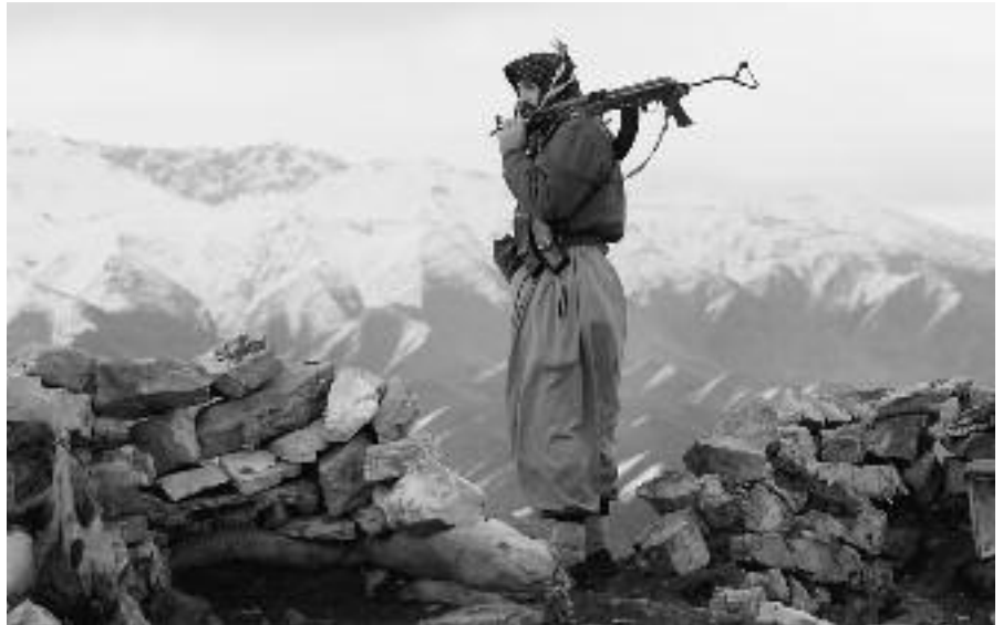
PKK-Kämpfer im türkisch-irakischen Grenzgebiet.

31. ermutigt die Regierung, ihre Anstrengungen zu verstärken, die gesetzlich garantierte Gleichstellung der Geschlechter in die Praxis umzusetzen; vertritt insbesondere die Ansicht, dass eine Strategie für die Bildung und Beschäftigung von Frauen ausgearbeitet werden sollte, um die Betätigung von Frauen in der Schattenwirtschaft zu verringern; fordert die Regierung auf, das Potenzial der Organisationen der Zivilgesellschaft auszuschöpfen, insbesondere bei der Sensibilisierung für die Rechte der Frau, die Verhütung von Gewalt und die sogenannten „Ehrenmorde“; weist darauf hin, dass die Regierung und die Justiz gewährleisten müssen, dass alle Fälle von Gewalt gegen Frauen und ihrer Diskriminierung ordnungsgemäß vor Gericht gebracht und die Verantwortlichen bestraft werden, und, dass Frauen und Kinder, die der Gefahr von Gewalt oder Ehrenmorden ausgesetzt sind, von den staatlichen Stellen geschützt und unterstützt werden; ermu-