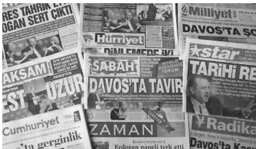
Die türkische Tagespresse ist einer restriktiven Gesetzgebung ausgesetzt.

Den Staatsanwälten mit ideologischer Brille standen oftmals lobenswerte Richter gegenüber, die die jeweiligen Bestimmungen enger auslegten und die Angeklagten freisprachen. Eine Anklage genügte aber oft schon zur Einschüchterung der Betroffenen – oder vor allem auch ihrer Verlage. Sie sahen sich auch Maßnahmen wie Durchsuchungen,