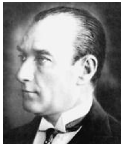
Kemal Atatürk schuf zu Beginn des 20. Jahrhunderts die Grundlage der Republik Türkei.

Missliebigen Journalisten, Künstlern oder Minderheitenvertretern werden auch „Anstiftung zu Hass, Feindschaft oder Erniedrigung“ nach Artikel 216, oder „Angriffe auf grundlegende nationale Interessen“ nach Artikel 305, „Anstiftung von Menschen zur Verweigerung des Militärdienstes“ nach Artikel