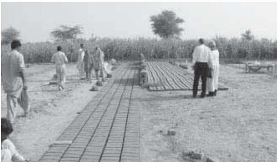
Besuch mit Bischof Joseph Coutts in einer Ziegelei nahe Faisalabad. Christliche Männer, Frauen, Jugendliche, Kinder formen in glühender Hitze im Akkord Lehm. Die Arbeiterinnen und Arbeiter besitzen keinerlei soziale Absicherung.