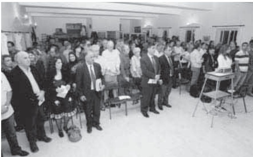
Die palästinensisch-jüdische Organisation „Parents Circle – Families Forum“ versucht, sowohl Juden als auch Palästinenser zu erreichen und von der Notwendigkeit für Versöhnung zu überzeugen. Im Bild eine gemeinsame Veranstaltung zum Internationalen Tag des Friedens am 5. Oktober 2010 in Beit Jala.

Sie haben sich für Versöhnung entschieden statt für Vergeltung. Sie ent-