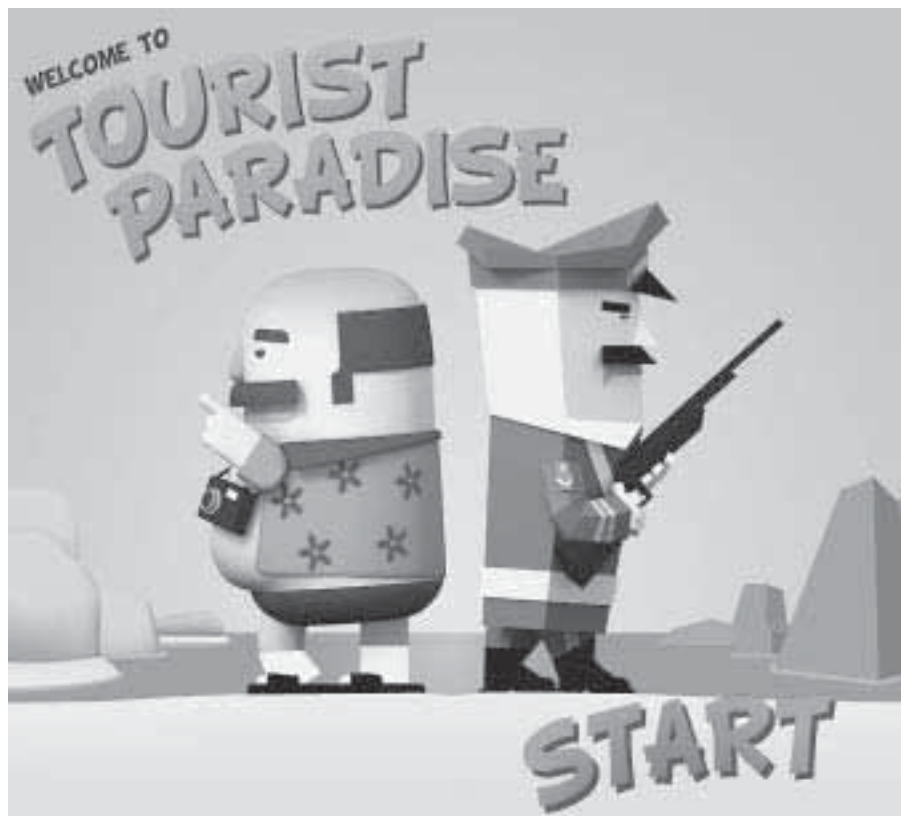
Start des Online-Spiels „Tourist Paradise“.

Das Spiel wird seit dem 7. Dezember 2010 auf verschiedenen Gaming-Plattformen hochgeladen. Sie finden das Spiel unter http://www.tourist-paradise.org/ – weiterverschicken des Links ist natürlich ausdrücklich erwünscht.