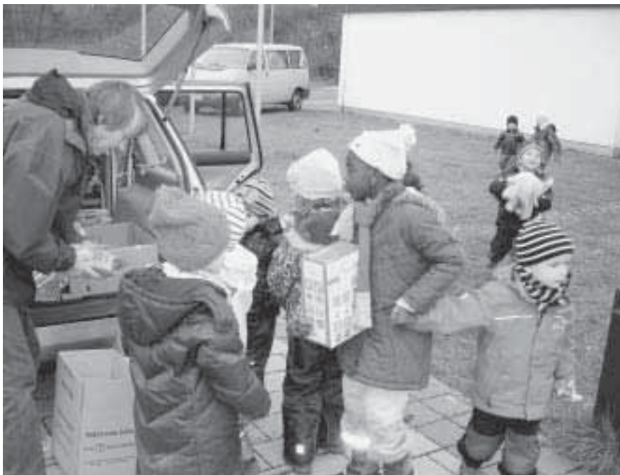
„Schmetterlinge“ und „Waldameisen“ vom katholischen Kindergarten Heilig Kreuz in Frankfurt Bergen-Enkheim fassten selbst mit an und halfen mit, Spielsachen und Lebensmittel für besonders Bedürftige zu packen.

Dieser Gedanke spornt auch die anderen Aktiven an. Zusammen haben die Ehrenamtlichen der Arbeitsgruppen im Jahr 2010 mehrere Tausend Stunden Arbeit aufgebracht. Dazu zählten nicht nur die direkte Organisation von Hilfe aus Frankfurt nach Rumänien, sondern auch viele andere Aufgaben, die letztendlich diese Hilfe erst möglich machen. Zum Beispiel der monatliche Flohmarkt, dessen Erträge in die Rumänienhilfe der IGFM fließen. Aber auch andere Arbeiten, etwa für Flüchtlinge,