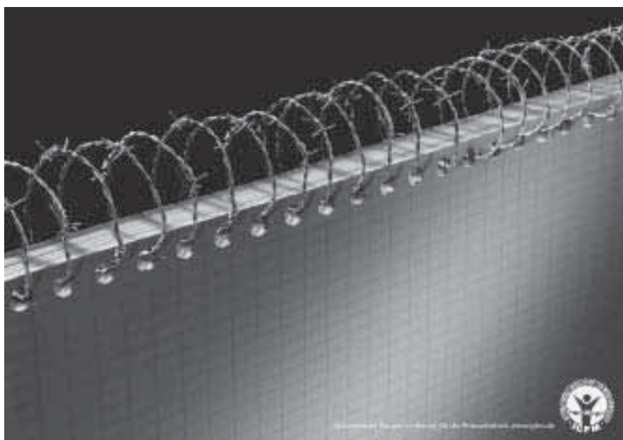
Ringblock Pressefreiheit, Anzeige der IGFM.