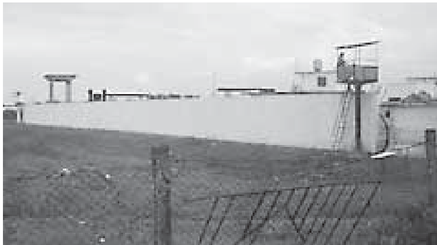
Das Gefängnis Canaleta von Ciego de Avila.

Die Wachen haben stets vermieden, uns als „politische Gefangene“ zu bezeichnen, aber da all die anderen Häftlinge uns „POLITICO“ nannten, wurde das so üblich. Wenn die Wachen uns meinten, benutzten sie die Abkürzung CR („Konter-Revolutionäre“). Wenn sie uns angesprochen haben, zogen sie es vor, unseren