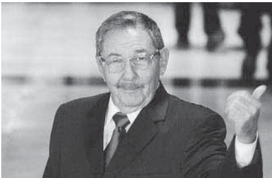
Raúl Castro muss in seinem 79. Lebensjahr mit den wirtschaftlichen Folgen von 50 Jahren Planwirtschaft fertig werden und will jetzt „aktualisieren“.

Der geplante wirtschaftliche Umbau verspricht – zumindest augenscheinlich