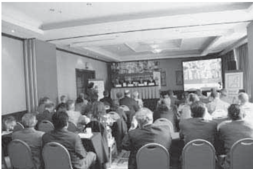
Über 70 internationale Experten nahmen an der Konferenz „Kuba – Ein Blick in die Zukunft“ teil.

Die Notwendigkeit, dass das fruchtbare Land 80 Prozent der Lebensmittel importieren muss, sprächen für sich. Der exilkubanische Wirtschaftswissenschaftler und Buchautor José Azel beklagte, die vom Regime angekündigten Wirtschaftsreformen würden dem Volk von oben nach unten aufgedrückt, statt auf die Bedürfnisse der Bevölkerung zu reagieren.