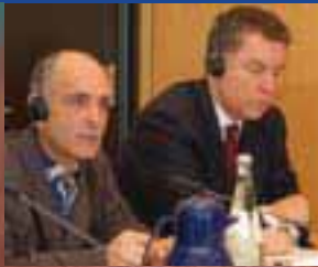
In Freiheit: Paneque mit seinem Paten, MdEP Ehler