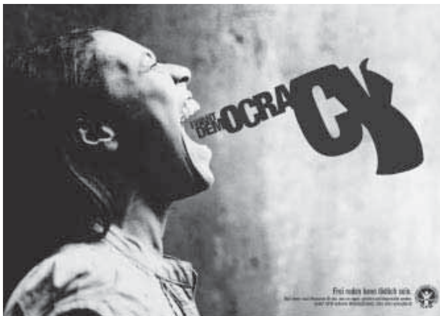
Schrei für Demokratie. Poster und Anzeige der IGFM.

Ich wurde regelmäßig in die Stadt Ciego de Avila zur Ultraschalluntersuchung