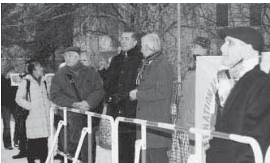
IGFM-Mahnwache vor der kubanischen Botschaft in Berlin.