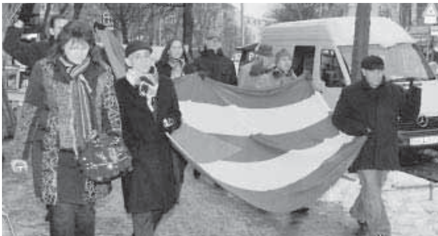
Teilnehmer des IGFM-Schweigemarsches auf dem Weg von der Gethsemanekirche (Kirche der Revolution) zur Botschaft der Republik Kuba.

Die Menschenrechtsaktivisten wurden dabei unter anderem als „Rassisten“, „Faschisten“, „Arschlöcher“ und „Würmer“ bezeichnet. Die kubani-