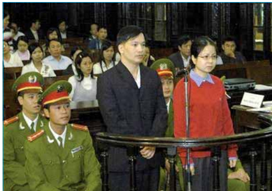
Mehnjährige Haftstrafen für die Menschenrechtsanwältin