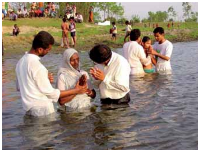
Taufe von Konvertiten in indischem Fluss