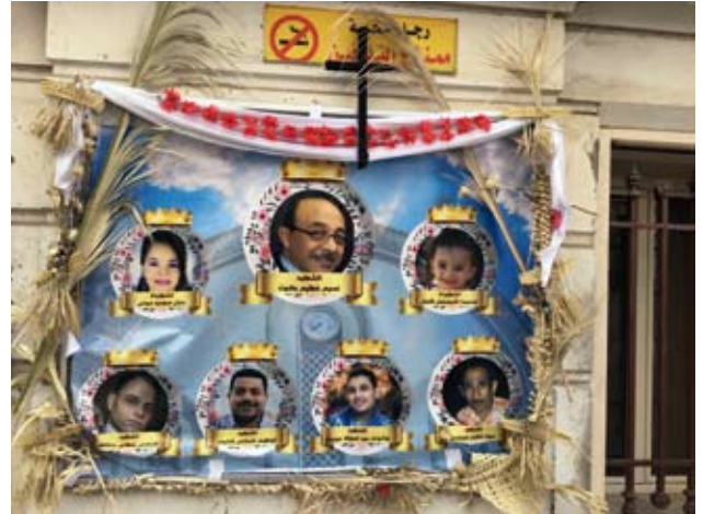
Plakat mit den sieben Opfern des Terroranschlags auf den koptisch-orthodoxen Patriarchatssitz in Alexandria/Ägypten

Was sich in der Statistik überhaupt nicht widerspiegeln kann, ist unsere große Sorge um die Christen in Ägypten. In dem Land am Nil lebt die größte christliche Minderheit des Nahen Ostens. Die beklagenswerte Tatsa-