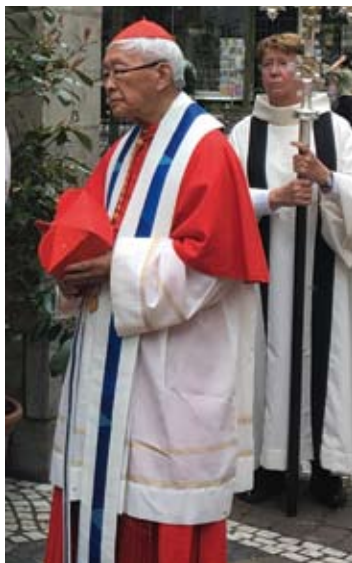
Der ehemalige Bischof von Hongkong Kardinal Zen