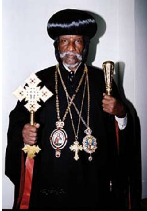
Patriarch Abune Antonios

Am 12. Juli 2017 wurde der seit 2006 unter Hausarrest stehende eritreisch-orthodoxe Patriarch Abune Antonios 90 Jahre alt. Er ist das prominenteste kirchliche Opfer der neomarxistischen Regierung. Ihm wurde 2012 der Frankfurter Stephanuspreis