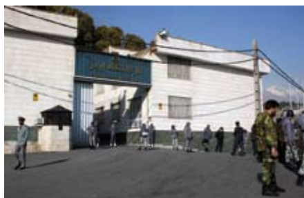
Das Evin-Gefängnis in Teheran, wo viele Glaubensgefangene schon eingesperrt wurden.

Seine Exzellenz Xi Jinping Staatspräsident, Generalsekretär der Kommunistischen Partei der Volksrepublik China via Botschaft der VR China Märkisches Ufer 54 10179 Berlin