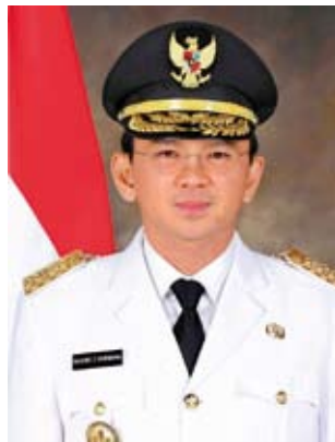
Basuki als Gouverneur

er gehe dagegen in Berufung: Nun hat er, um die interreligiösen Spannungen nicht weiter eskalieren zu lassen, seinen Antrag zurückgezogen und die Haft auf sich genommen. Damit ist er, obwohl einst aussichtsreicher Kandidat, auch politisch aus dem Rennen.