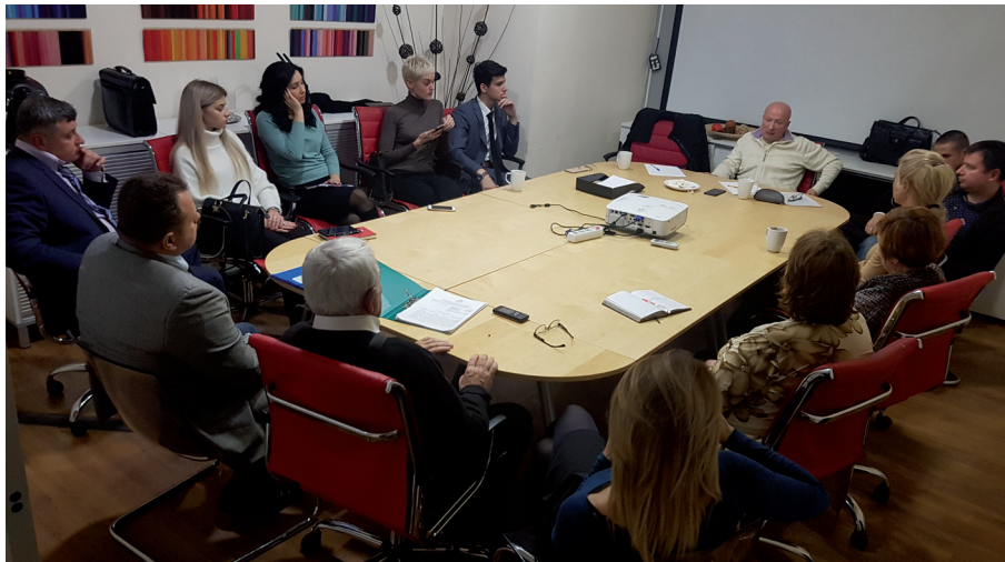
ÖPR-Seminar in Moskau November 2019

In den letzten fünf Jahren war sie im Rahmen des vom Auswärtigen Amt unterstützten IGFM-