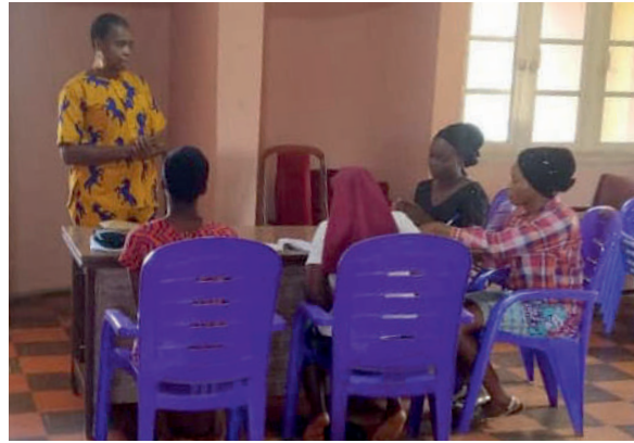
Frauen lernen in der Nazareth-Schule für ein neues Leben

Im September 2021 war die katholische Ordensschwester Ro-