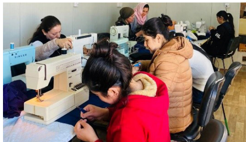
Mit-Nähkursen fing alles an; Fotos: Kh. Al-Rasho/IGFM

Jetzt, da die irakische Regierung die Auflösung der Lager beschlossen hat, versuchen immer mehr Flüchtlinge, in ihre Heimat – das Shingal-Gebiet – zurückzukehren. Abgesehen von den immer noch nicht gelösten Eigentumsfragen und der Unsicherheit aufgrund gewaltbereiter Banden und Clans ist der Mangel an Handwerkern das größte Problem beim Wiederaufbau. Im gesamten Shingal-Gebiet sind momentan nur 15 kleine Handwerksunternehmen tätig. Der Bedarf ist also immens.