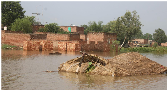
Anhaltende Regenfälle führten zu schwersten Überschwemmungen in der pakistanischen Provinz Punjab.

keine Unterstützung, die ebenso von den jüngsten Überschwemmungen betroffen ist“, berichtet der Leiter einer örtlichen christlichen Organisation. „Es ist wichtig zu betonen, dass bei zahlreichen Gelegenheiten die von der Regierung geleistete Hilfe die christliche Bevölkerung nicht erreicht“, schreibt ein katholischer Pfarrer. Und der Pastor einer presbyterianischen Gemeinde beklagt: „Regierungsstellen und andere Einrichtungen haben sich bemüht, aber in unserer Gemeinde ist keine angemessene Unterstützung angekommen.“